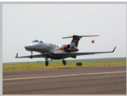
Segundo protótipo do Phenom 300

Operação – Em julho, a frota do Phenom 100 completou mil horas de voo e aproximadamente 700 ciclos. Alguns proprietários individuais estão operando uma média de 30 horas por mês. Durante a viagem para a EBACE, partindo de Houston, EUA, para Genebra, Suíça, o Phenom 100 atingiu velocidades impressionantes em rotas desafiadoras e bateu recorde norte-americano de velocidade em rota reconhecida ( speed over a recognized course ). O Phenom 100 se juntou ao Phenom 300, Legacy 600 e Lineage 1000 na mostra estática da EBACE, onde os quatro modelos foram exibidos juntos pela primeira vez.