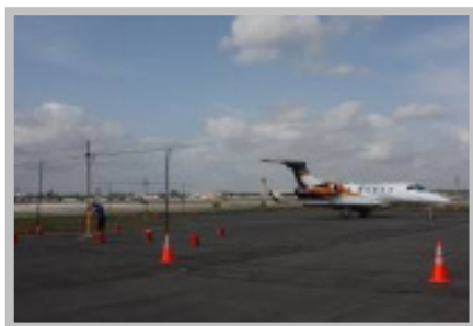
Teste de campo eletromagnético de alta intensidade