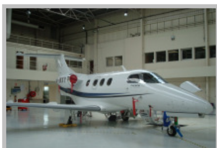
Phenom 100 no centro de serviços para jatos executivos da Embraer em Le Bourget

Segundo protótipo – O segundo protótipo do Phenom 300 (PP-XVJ) foi utilizado para realizar os seguintes testes: operação em pista molhada ( water spray ), detecção de fogo no motor, avaliação de ruído externo, análise inicial de controlabilidade do motor, expansão do envelope de V mo (velocidade máxima operacional), extinção de fogo e partida em vôo do motor, obtenção de dados para o simulador de vôo e ensaios de combustível. Os testes do piloto automático estão atualmente em execução.