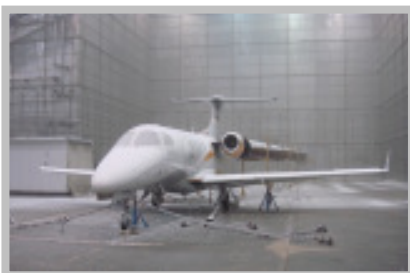
Teste de operação em baixas temperaturas ( cold soak )