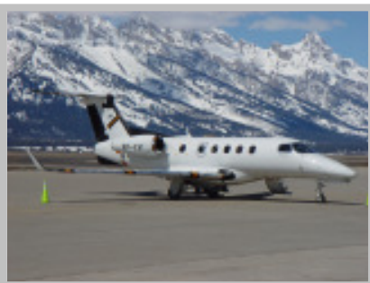
Ensaio sob vento cruzado ( cross wind ) nos EUA