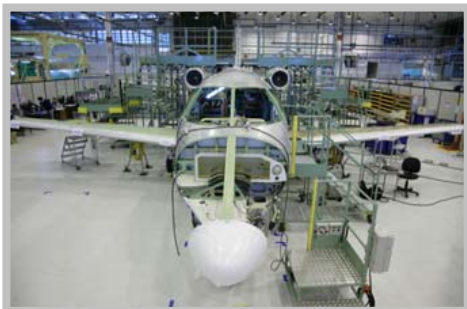
Phenom 100 na montagem final

A asa e a fuselagem foram montadas em Botucatu e chegaram à planta principal no final de março. Simulações virtuais da produção garantiram a precisão e o sucesso da primeira junção asa-fuselagem do Phenom 100.