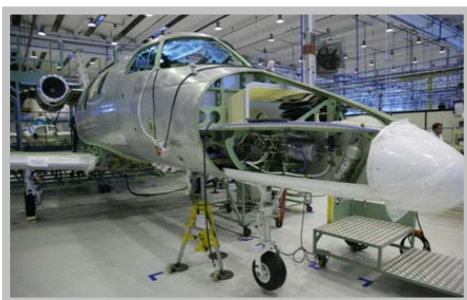
Sistemas instalados no Phenom 100