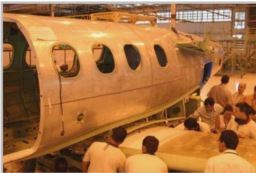
Junção asa-fuselagem do primeiro Phenom 100

Sistemas e Componentes – Os sistemas da asa e da fuselagem estão sendo integrados. Os sistemas anemométricos, elétricos, hidráulicos, de oxigênio, de combustível e degelo já foram instalados. Além desses, o primeiro Phenom 100 está recebendo toda a instrumentação de teste de voo, consoles e painéis do cockpit , trem de pouso, freios, pneus, janelas e radar.