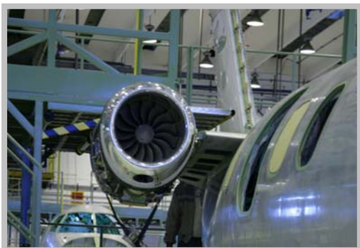
Motor PW617F Pratt & Whitney