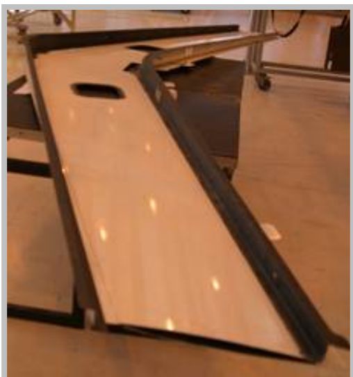
Estabilizador horizontal em material composto