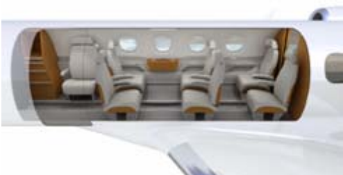
Configuração com assento de face para a entrada