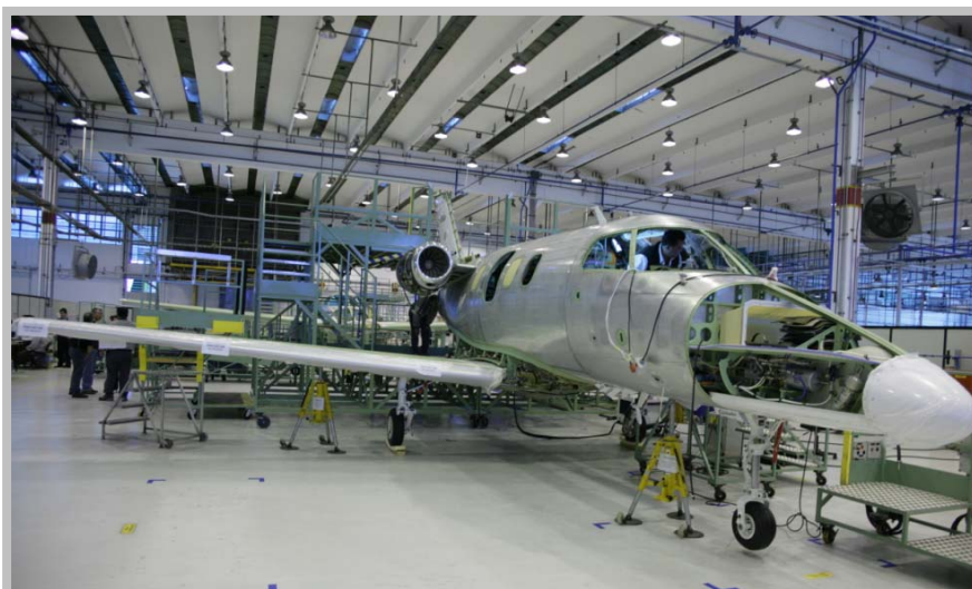
Montagem do primeiro Phenom 100