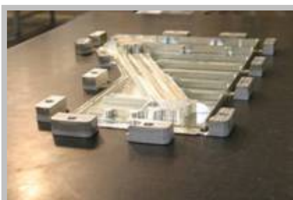
Primeira peça do Phenom 300

Anunciados em maio de 2005, os programas Phenom progredem como previsto. A expectativa é que o Phenom 100 faça seu vôo inaugural em meados deste ano e entre em serviço em 2008 e o Phenom 300 voe pela primeira vez em meados 2008 e inicie sua operação em 2009.