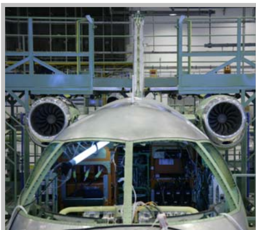
Instrumentos para teste de voo

Material Composto – O Phenom 100 recebeu as suas primeiras peças primárias feitas em material composto, os estabilizadores vertical e horizontal. Cerca de 20% do peso estrutural da aeronave consiste em peças fabricadas em material composto, algumas delas são o radome, o leme de direção, compartimento de bagagem no nariz, carenagem da asa-fuselagem, ponta da asa, caverna de pressurização traseira, cone de cauda, barbatana dorsal, carenagem do estabilizador vertical-horizontal, profundor e aileron.