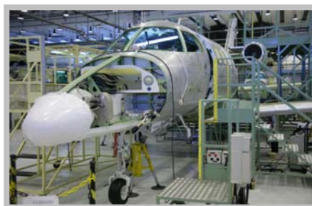
Primeiro Phenom 100