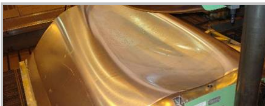
Parte da fuselagem traseira do Phenom 300