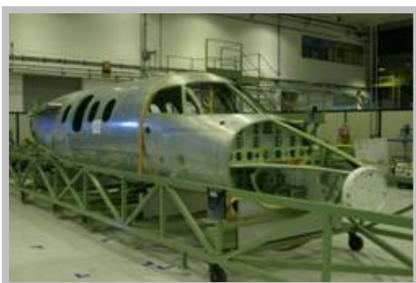
O segundo Phenom 100 em São José dos Campos