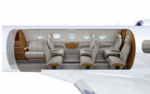
Configuração com diva de face para a entrada