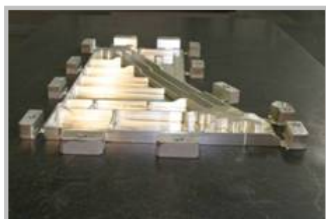
Primeira peça do Phenom 300

O primeiro corte de metal – Em março, uma máquina fresadora de alta velocidade com cinco eixos fez a primeira peça da aeronave na planta principal, em São José dos Campos.