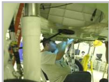
Trem de pouso do primeiro Phenom 100

O segundo e o terceiro Phenom 100 – Fuselagem e asa do segundo Phenom 100 já chegaram a São José dos Campos para dar início à montagem final. O terceiro Phenom 100 está em pré-montagem na planta de Botucatu e também seguirá para a unidade principal da Embraer.