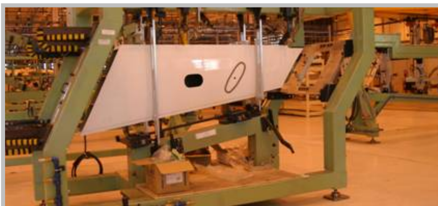
Estabilizador vertical em material composto