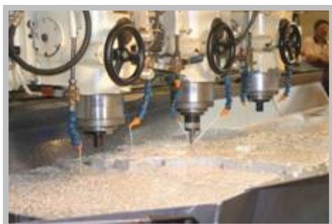
Primeiro corte de metal para o Phenom 300

Projeto – O programa Phenom 300 completou as revisões críticas de projeto e os desenhos já estão sendo entregues para o planejamento de fabricação e desenvolvimento ferramental – ambos processos já iniciados. Após o primeiro corte de metal, mais de 100 peças já foram feitas.